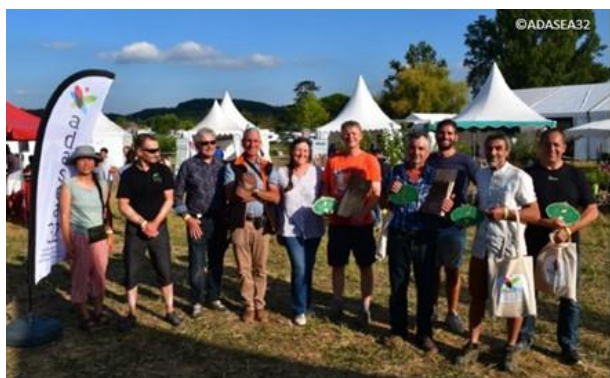
Remise des prix à Gascogn'Agri, le 4 septembre 2021 à Caillavet